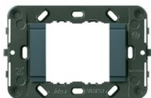
16722.L - Supporto 2M liscio scat.inc.3M grigio