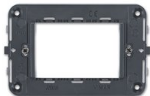
16723 - Supporto 3M Arké Idea + viti grigio