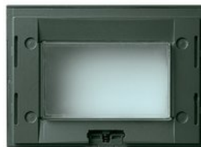
16813.Q - Supporto IP55 3M grigio