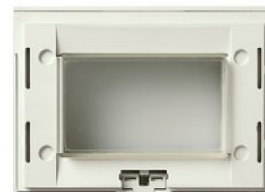
16813.Q.B - Supporto IP55 3M bianco