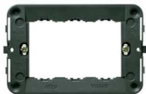
16713 - Supporto 3M +viti